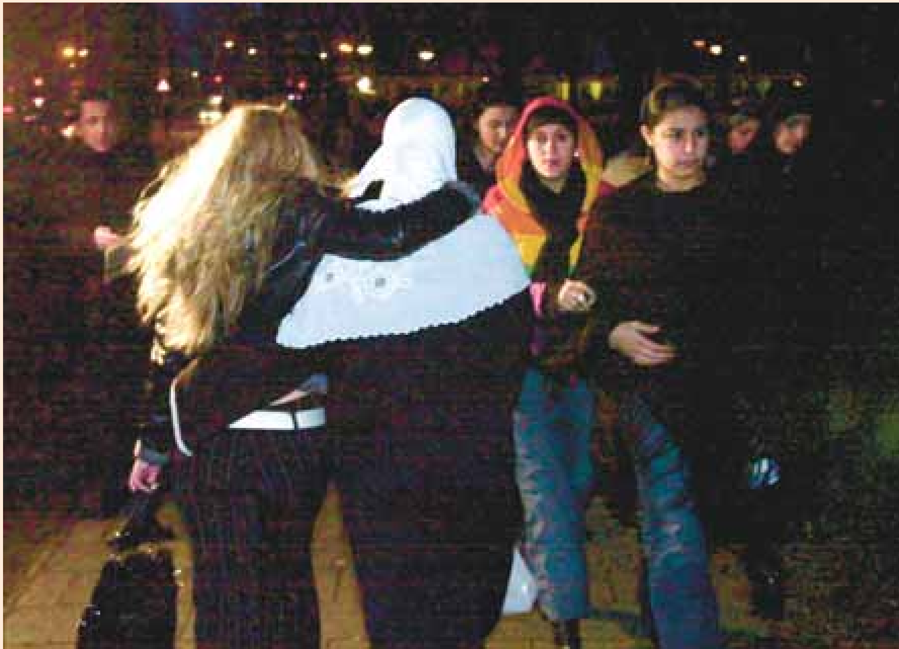
Leerlingen komen aan op school. Op het Terra College worden vandaag geen lessen gegeven, maar de deuren staan open voor leerlingen om hun gevoelens te uiten. Voor het gebouw aan de Beresteinlaan zijn bloemen neergelegd en branden kaarsjes. De vlag hangt halfstok.